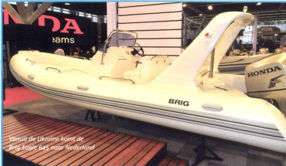
Vanuit de Ukraine komt de Brig Eagle 645 naar Nederland

Rubberboot Benelux Telefoon: 020-4536262