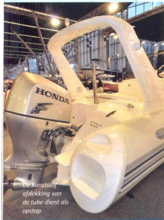
De kunststof afdekking van de tube dient als opstap