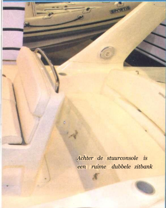
Achter de stuurconsole is een ruime dubbele zitbank