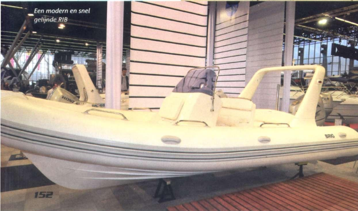
Een modern en snel gelijnde RIB