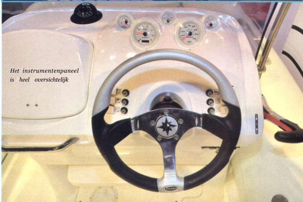
Het instrumentenpaneel is heel overzichtelijk